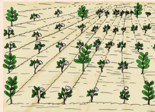
12 Associer avec des cultures annuelles (coton, maïs, arachide, igname, niébé, etc.)