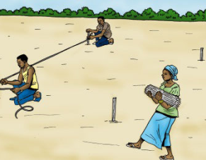
2 Faire un piquetage (10m x 10 m)