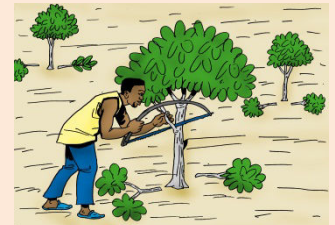
13 Faire la taille de formation