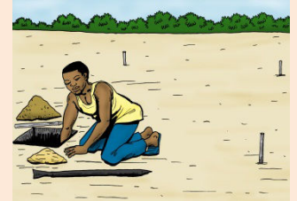
3 Creuser en mettant d'un côté la terre de surface et de l'autre la terre de profondeur