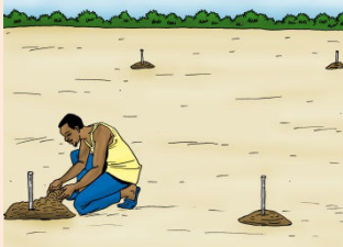
4 Reboucher les trous après au moins 2 semaines en commençant par la terre de surface