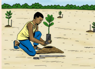
5 Planting : creuser un trou à la dimension de la motte de terre qui couvre les racines de la plantule ; déchirer le bas du sachet qui enveloppe la plantule ; déposer le tout dans le trou puis retirer le sachet et tasser la terre autour du plant