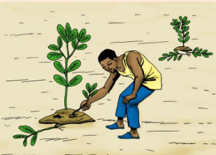
10 Faire le demariage après un an