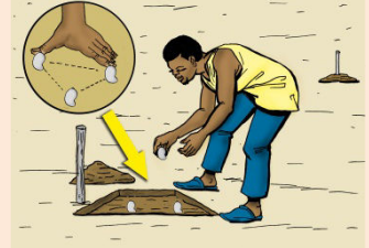
9 Faire le semis direct