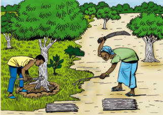
1 Défricher le terrain vierge ou sarcler la jachère