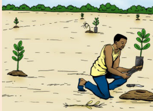
7 Remplacer les plants morts ou malades