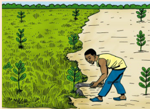
11 Sarcler la jeune plantation