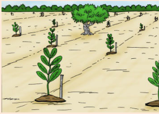
6 Maintenir les piquets à côté des plants